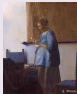
La femme en bleu lisant une lettre, Johannes Vermeer, (Rijksmuseum, Amsterdam)