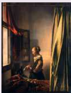
La Liseuse à la fenêtre, Johannes Vermeer. (Gemäldegalerie Alte Meister, Dresde).

Exposition Vermeer au Rijksmuseum à Amsterdam du 10 février au 4 juin 2023