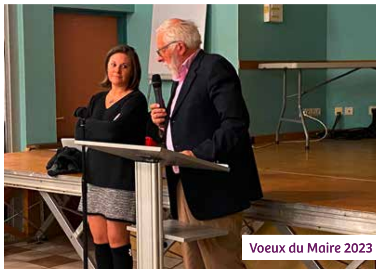
Vœux du Maire 2023